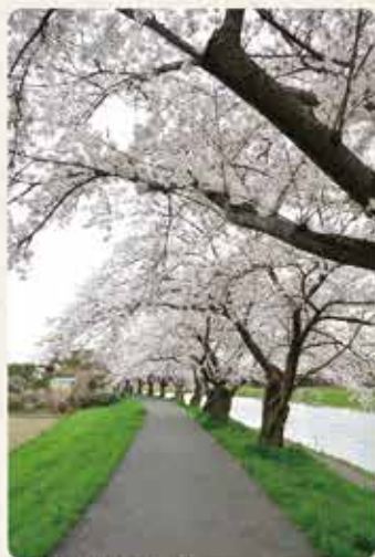
元荒川沿いの桜堤